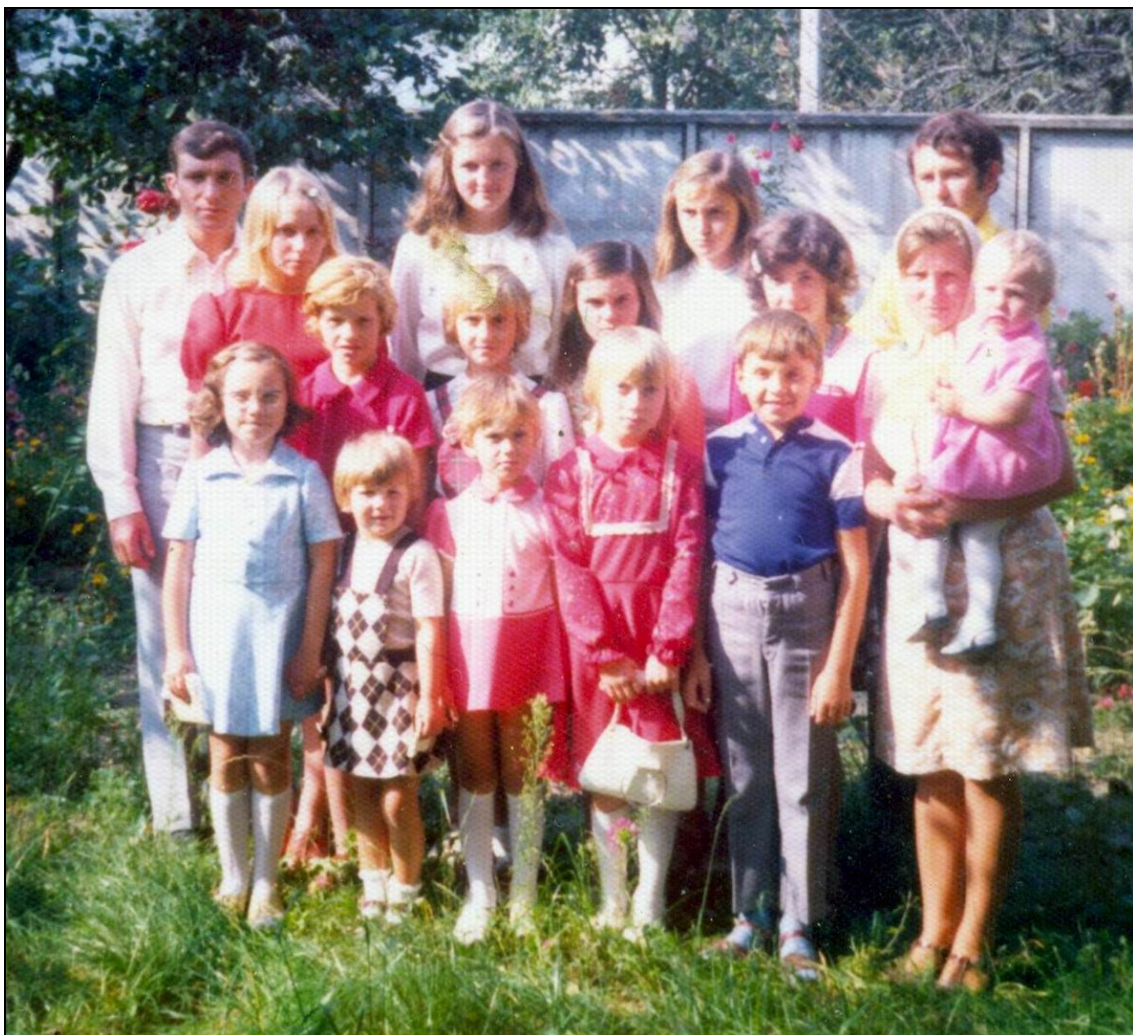
Nedel'ná škola 1977