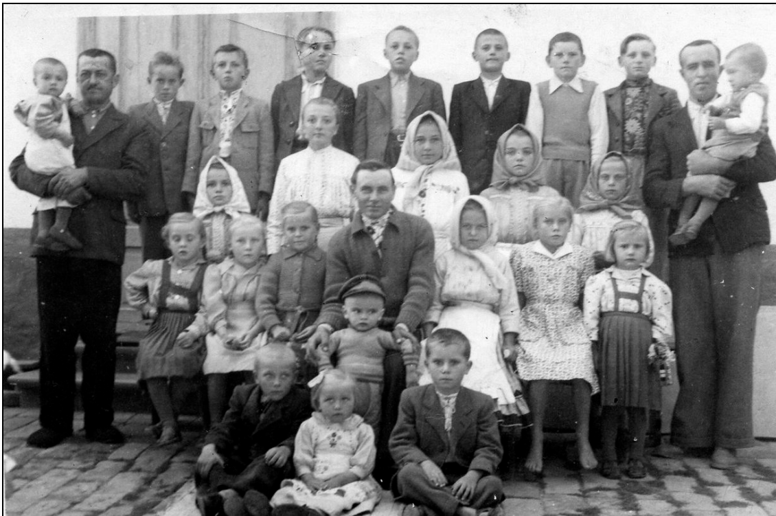
Nedel'ná škola 1950