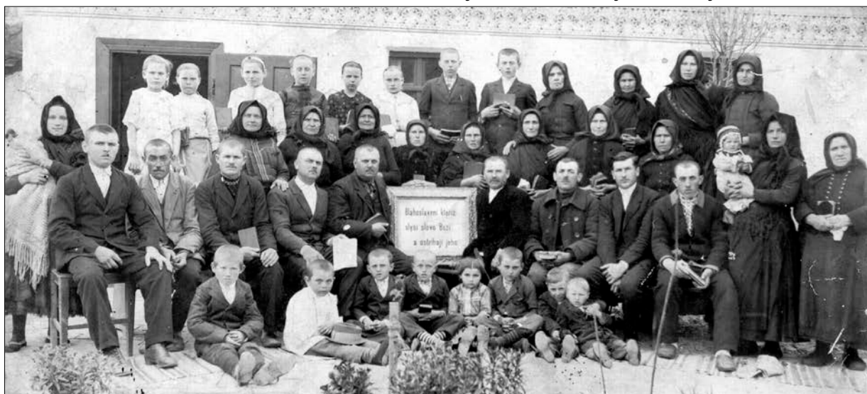
Erdevický zbor v 1927 roku

Roku 1921 sa z Hložian do Erdevíka vystaľovali štyri rodiny: Korčokovci,