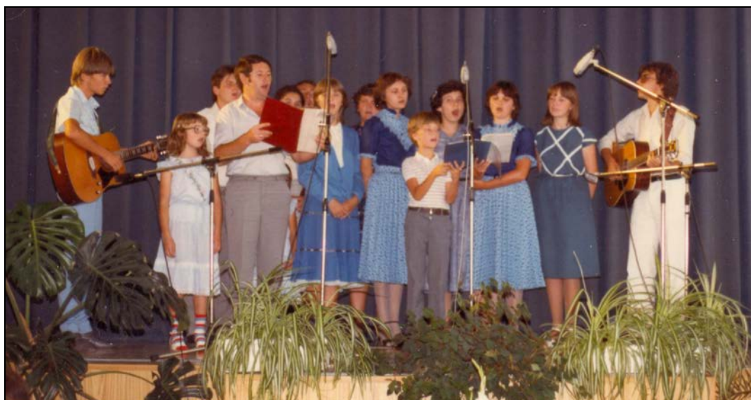
Mládež v 1984 v Novom Sade